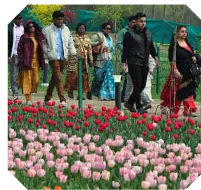
more dazzling display across 70 vibrant varieties-think crimson reds, sunny yellows, and pastel pinks

Head to Srinagar sooner than expected-Asia's largest tulip garden on Dal Lake's banks swings open to the public on March 16, a full 10 days ahead of schedule, thanks to Kashmir's warmest February in decades sparking an early floral frenzy. Chief Minister Omar Abdullah will inaugurate the Indira Gandhi Memorial Tulip Garden, a Kashmir gem since 2008 that typically unfurls in late March. This year, balmy days have coaxed over 1.8 million bulbs into a denser,